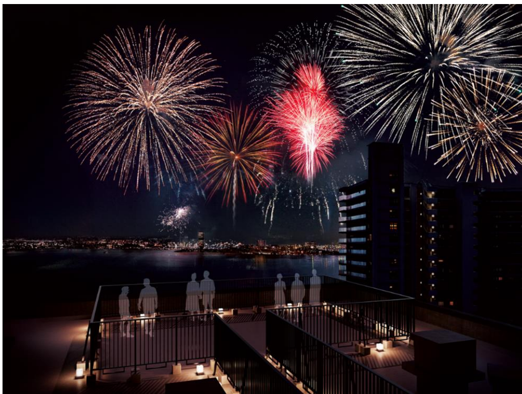
※屋上テラス完成図(※4)

当社が早くから湖西エリアに着目してきた理由のひとつは、琵琶湖の眺望(※2)と住空間の心地よさを両立しやすい立地特性にあります。琵琶湖の南側で住戸から湖を望もうとする(※2)と、北向きの住戸計画になりやすい一方、湖西エリアでは東向きや南向きのバルコニー、リビングを確保しながら琵琶湖を望める(※2)住戸を計画しやすく、朝の光を取り込みやすい明るい住空間を実現できます。住戸によっては、琵琶湖花火大会(※3)をリビングから楽しめるなど、この地ならではの魅力を日常の中で感じていただけます。